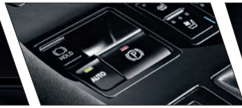
Freio de estacionamento eletrônico