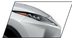
Branco Sônico (085) Exclusiva para RX 450hL Luxury