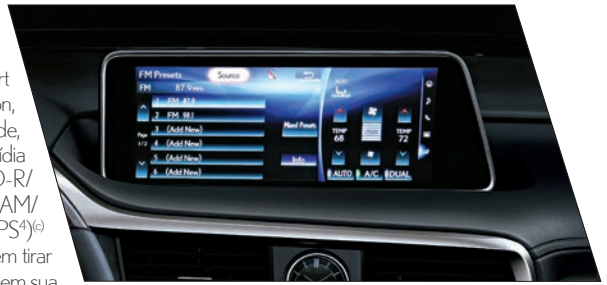
Sistema multimídia com tela de LCD de 12,3" touch screen e conectividade com Android Auto® e Apple CarPlay®

Com itens de série capazes de surpreender, a linha RX apresenta as tecnologias Smart Entry, que permite travar e destravar as portas sem a utilização da chave, e Start Button, com a qual o motor é acionado ao toque de um botão, privilegiando a comodidade, além de ter conectividade Apple CarPlay® e Android Auto®. Com o sistema multimídia Lexus com tela de LCD 2 de 12,3" touch screen compatível com DVD player (b) , CD-R/RW, MP3, WMA 3 + sistema Bluetooth® (com microfone e amplificador) + rádio AM/FM, o motorista tem acesso às funções de TV digital (b) , sistema de navegação (GPS 4 ) (c) e câmera de ré (com linhas-guia auxiliares) por meio do controle remote touch, sem tirar as mãos do console central, e câmera com visão 360° (Panoramic View Monitor), em sua versão Luxury. A linha RX ainda conta com Sistema de Assistência ao Arranque em Subida (HAC 5 ) e freio de estacionamento eletrônico (EPB 6 ).