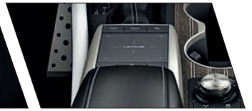
Controle touchpad para o sistema multimídia Lexus

2 LCD: Liquid-crystal Display (Tela de Cristal Líquido). 3 WMA: Windows Media Audio. 4 GPS: Global Positioning System (Sistema de Posicionamento Global). 5 HAC: Hill-start Assist Control. 6 EPB: Electric Parking Brake. (b) Por questões de segurança, as imagens da TV digital e do DVD player não serão exibidas enquanto o veículo estiver em movimento. (c) O funcionamento do GPS depende da disponibilidade de sinal da região, bem como de outros fatores, como visão desobstruída do céu. A recepção do sinal, por sua vez, pode ser interrompida facilmente por películas protetoras nos vidros, telefones móveis ou dispositivos eletrônicos, rastreadores próximos ao GPS, existência de árvores, edifícios ou fiação elétrica. Nem todos os municípios do território nacional estão presentes na área de cobertura do mapa. Micro SD Card: Para sua segurança, não manuseie o cartão de memória SD Card quando estiver dirigindo. Quando o cartão de memória SD Card não estiver inserido, nenhum mapa será exibido no sistema multimídia. Recomendamos que, ao deixar o veículo, o condutor mantenha o SD Card em local não visível a fim de evitar que seja roubado. No caso de perda, roubo ou dano (que impossibilite o uso), outro cartão de memória SD Card poderá ser adquirido na Rede Autorizada Lexus.