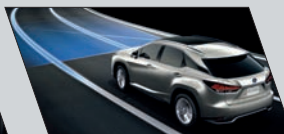
Sistema de saída de Faixa (Lane Tracing Assist - LTA)