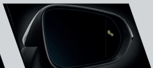
Sistema de identificação de ponto cego (Blind Spot Monitor)