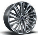
Rodas de liga leve de 20" (versão Luxury)