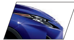
Azul Olímpio (8X1) Exclusiva para RX 450h F-SPORT