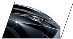
Preto Grafite (223) RX 450hL Luxury e RX 450h F-SPORT