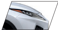
Branco Super Nova (083) Exclusiva para RX 450h F-SPORT