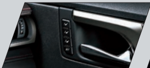
Versão Luxury com comando para memória nos bancos do motorista e do passageiro