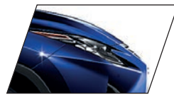
Azul Royal (8X5) RX 450hL Luxury e RX 450h F-SPORT