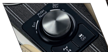
Seleção de modo de condução: Eco, Normal, EV, Sport e Sport+