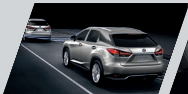
Controle de velocidade de cruzeiro adaptativo (Adaptive Cruise Control) acima de 40 km/h