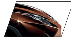
Marrom Âmbar (4X2) Exclusiva para RX 450hL Luxury