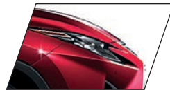
Vermelho Coral (3R1) RX 450hL Luxury e RX 450h F-SPORT