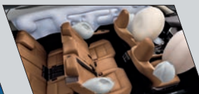
Sistema de proteção com dez air bags