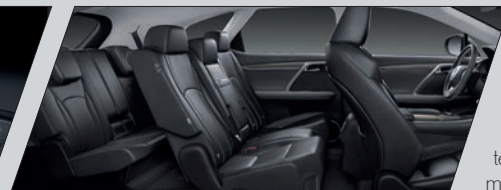
Versão Luxury com 7 lugares

O Lexus RX 450h apresenta bancos dianteiros com regulagem elétrica para doze posições (versão F-SPORT), incluindo ajustes de distância, inclinação, altura e lombar, e controle de memória com capacidade para armazenar até três perfis + função Return & Away para o banco do motorista - com a qual o banco se recolhe automaticamente ao se desafivelar o cinto de segurança, facilitando a saída do motorista. Os bancos traseiros (2ª fileira) ainda contam com sistema de aquecimento para máximo conforto. O motorista também conta com a direção eletroassistida progressiva (EPS 7 ), que facilita a realização de manobras, e a coluna de direção com regulagem elétrica de altura e profundidade, promovendo mais conforto ao dirigir. Além disso, o SUV apresenta comando elétrico interno para abertura e fechamento do porta-malas, privilegiando a comodidade. A versão Luxury, agora com 7 lugares, conta com uma terceira fileira de assentos com rebatimento elétrico, e os bancos do motorista e do passageiro dianteiro têm regulagem elétrica para 14 posições. Além de ter ganhado o comando elétrico interno, o RX 450h Luxury apresenta agora o sistema de hands-free para abertura e fechamento eletrônico do porta-malas.