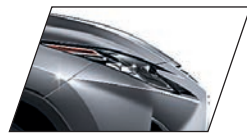
Cinza Mercúrio (1H9) RX 450hL Luxury e RX 450h F-SPORT