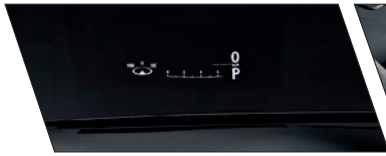
Head-up Display com informações sobre velocidade, navegação, GPS, áudio e sistema de direção