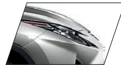
Cinza Titânio (1J7) RX 450hL Luxury e RX 450h F-SPORT