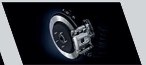
Freios a disco nas quatro rodas com ABS, EBD e BAS