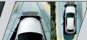
Câmera com visão 360° (Panoramic View Monitor) - somente na versão Luxury