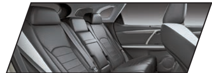
Preto F-SPORT com Branco

*Acabamento interno com partes revestidas de couro (parte anterior dos bancos dianteiros e traseiros, e parte anterior dos apoios de cabeça dianteiros e traseiros) e partes revestidas de material sintético derivado de PVC (laterais e parte posterior dos bancos dianteiros, laterais dos bancos traseiros, e laterais e parte posterior dos apoios de cabeça dianteiros e traseiros). **Itens em padrão madeira: material de resina plástica, imitação de madeira. As opções de madeira estão condicionadas à escolha da cor do revestimento de couro, conforme combinação apresentada neste material.