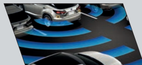
Alerta de tráfego traseiro (Rear Cross Traffic Alert)