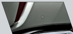
Sensores de estacionamento dianteiros (4) e traseiros (4)