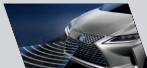
Assistente de pré-colisão (Pre-crash System - PCS) com alerta sonoro e visual e, se necessário, frenagem automática (acima de 20 km/h)

O Lexus RX 450h apresenta um sistema com dez air bags, sendo dois frontais, dois laterais dianteiros, dois laterais traseiros, dois de cortina, um de Joelho para motorista e um de assento para passageiro dianteiro. O sistema de Controle Eletrônico de Estabilidade Veicular (VSC 8 ) auxilia na estabilidade do veículo em curvas, e os freios a disco nas quatro rodas possuem sistema ABS 9 , que evita o travamento das rodas, com EBD 10 , que contribui para manter a estabilidade do veículo em frenagens de emergência, e BAS 11 , que amplia a força de frenagem. Além disso, conta com a novidade do farol alto automático (Auto High Beam - AHB) para aumentar a segurança nas vias. Para completar, o Controle Eletrônico de Tração (TRC 12 ) impede a perda de aderência das rodas motrizes, principalmente durante arrancadas ou curvas. A tecnologia AVS (Adaptive Variable Suspension) foi adotada para a versão de 7 lugares para garantir a segurança, mesmo essa versão tendo uma carroceria maior.